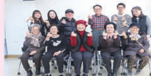
건전지와 함께하는 건강교실 평가회