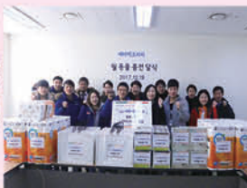
에바텍코리아와 함께하는 월동물품지원