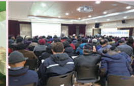
노인사회활동지원사업 하반기 간담회 및 평가회