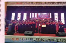
아리솔합창단 제 1회 가사평 시니어 합창 경연대회 은상 수상