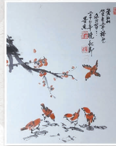
꽃피는 우리집, 신영철