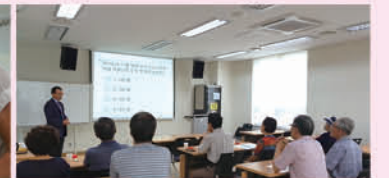
신한 해피실버 금융교실