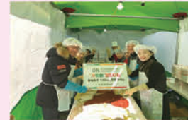
경기농식품유통진흥원과 함께하는 김장행사