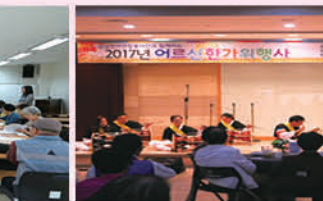
삼성전자 연합봉사단과 함께하는 한가위 행사