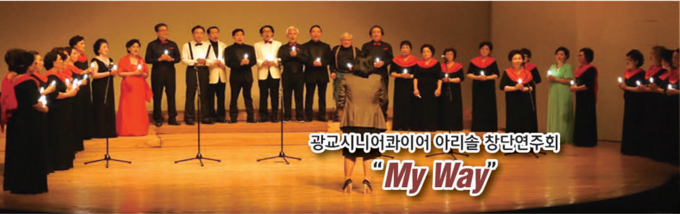
광교시니어콰이어 아리솔 창단연주회 "My Way"