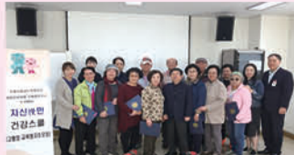
고혈압 교육형 자조모임 수료