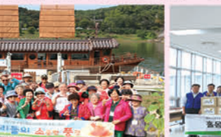
하나로TNS와 함께하는 추석맞이 행사