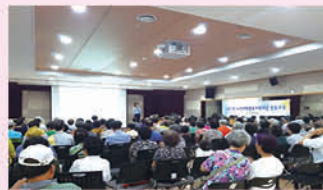
노인사회활동지원사업 상반기 간담회 및 평가회