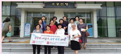
문화예술교육지원사업 음악반 공연관람