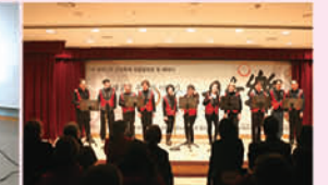
제 4회 평생교육 문화축제 '우리들의 이야기 어울락'