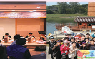
재가어르신 추계 나들이