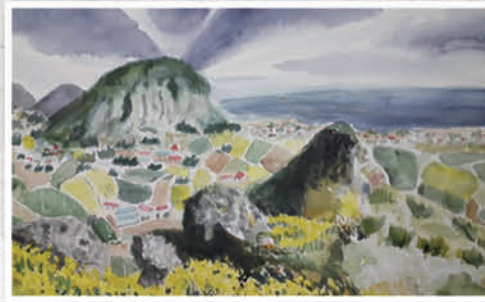
제주도 산방산, 임옥덕