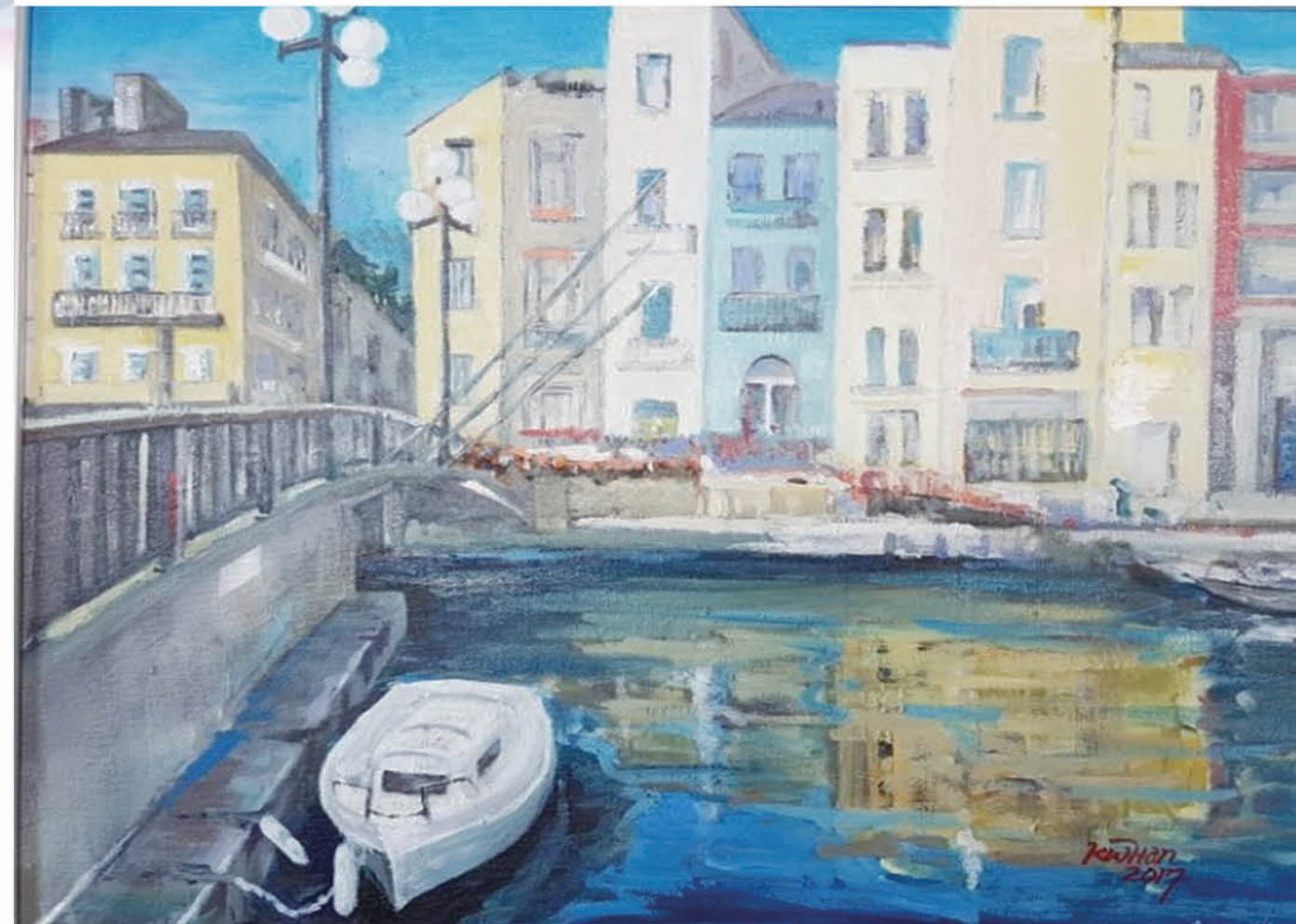
도시풍경(이탈리아 남부 시칠리아), 서양미술반 한광우 어르신 작품