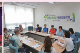
평생교육 9월 대표임원회의