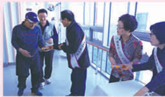
추수감사절 맞이 나눔 행사