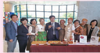
제10회 수원시 노인의날 기념식