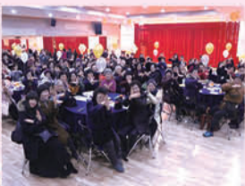
재가어르신 송년행사 "사랑애틀인"