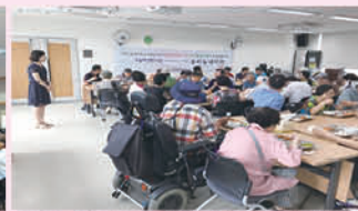
우리 지역 어르신 식사 지원 '선한이웃밥상'