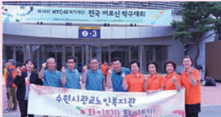
'제14회 전국 어르신 탁구대회' 참가