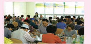
KT와 함께하는 우리동네 효사랑