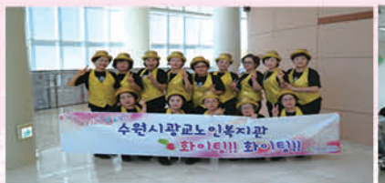
9988 특특쇼 시즌2 예선 참가 (라인댄스반)