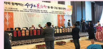
삼성전자와 함께하는 칠팔구순잔치