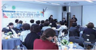
민·관 협력 간담회