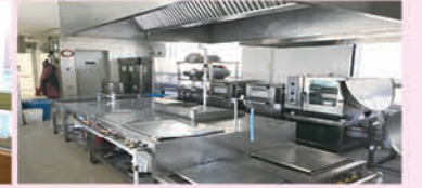
경로식당 주방 확장공사 완료