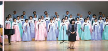
광고시니어콰이어 아리솔 "창단연주회"