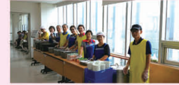
대표임원단 봉사활동 및 8월 임시회의