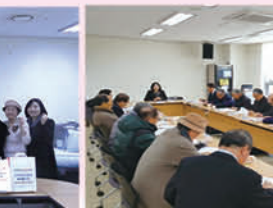
하반기 경로당 임원진 간담회