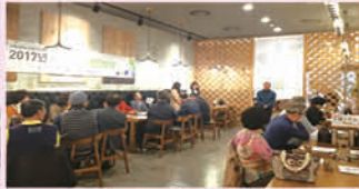
평생교육 하반기 운영간담회