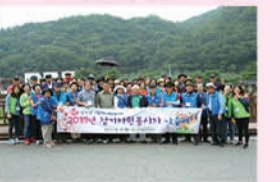
자원봉사자 나들이(충북 제천)