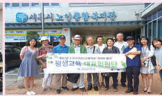
평생교육 대표임원단 '우수기관 견학'