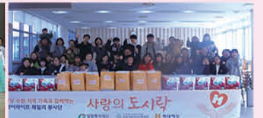
현대해상과 함께하는 사랑의 도시락 만들기