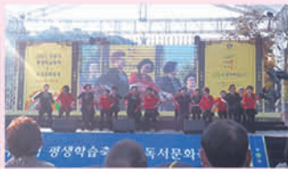
수원시 평생학습축제 참가