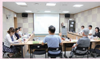
2차 후원회 정기회의