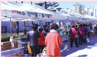
모금행사 하루차집 만나다.