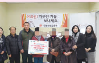
우체국 행복나눔 주간행사 업무협약식 및 물품전달식