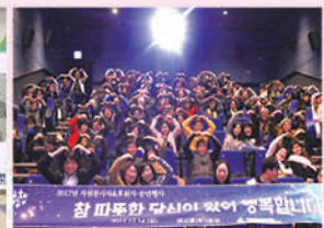
2017년 자원봉사자 & 후원자 송년행사